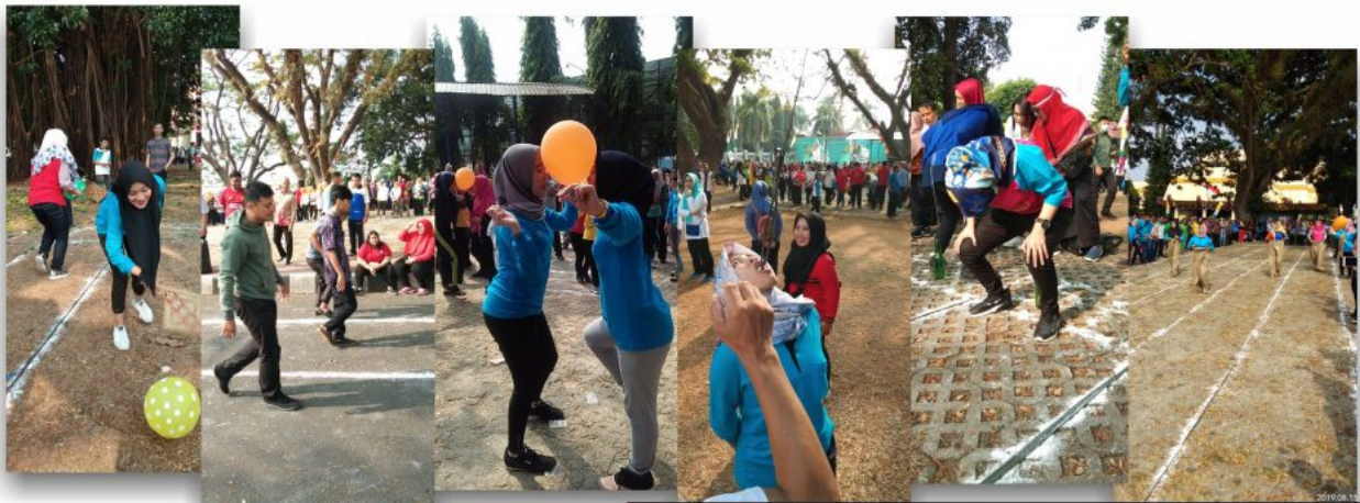
Keseruan Tim Dinkes Lampung di perlombaan dalam rangka HUT RI ke - 74, di Lingkungan Kantor Gubernur Lampung. hari ini (Kamis, 15/08/19).

Pemerintah Provinsi Lampung dalam hal ini mengadakan rangkaian kegiatan menjelang peringatan puncak HUT RI ke – 74, yaitu perlombaan antar OPD (Organisasi Perangkat Daerah) yang mengirimkan utusannya untuk mengikuti acara tersebut. Perlombaan dilaksanakan di lingkungan kantor Gubernur Lampung hari ini (Kamis, 15/08/19).