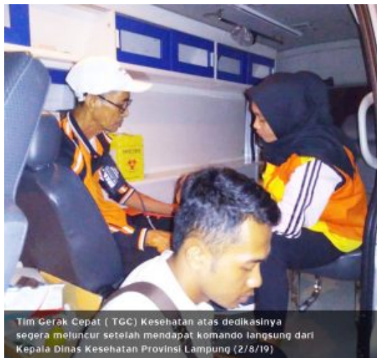
Tim Gerak Cepat ( TGC) Kesehatan atas dedikasinya segera meluncur setelah mendapat komando langsung dari Kepala Dinas Kesehatan Provinsi Lampung (2/8/19)

Gubernur Lampung Ir. Arinal Djunaidi dan Wakil Gubernur Hj. Chusnunia Chalim ikut turun menenangkan masyarakat yang mengungsi di Kantor Gubernur Lampung dan menghimbau kepada masyarakat agar tetap tenang karna Status Waspada dari BMKG sudah Berakhir untuk seluruh wilayah Indonesia.